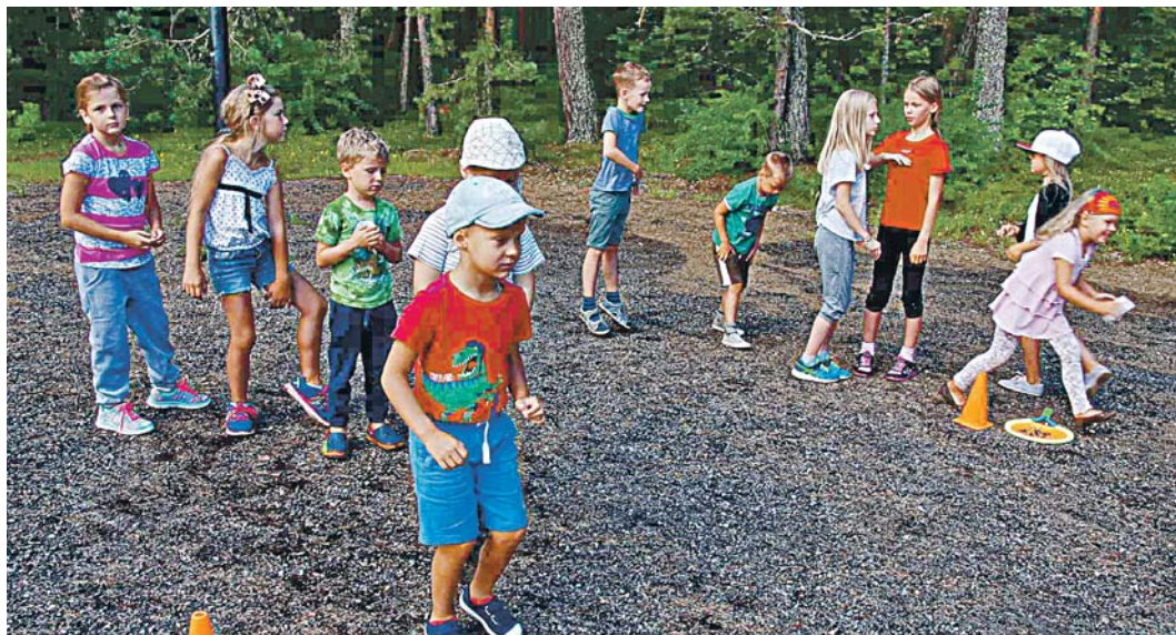
Laagris sai kaasa lüüa traditsioonilistes laagritegevustes – erinevad sportmängud, teatevõistlused ning liikumine.

Tunnustus koos kultuuripremia ja Jõelähtme vallavalitsuse tänukirjaga antakse üle õpetajate ja kultuuritöötajate pidulikult vastuvõtul oktoobris 2016.