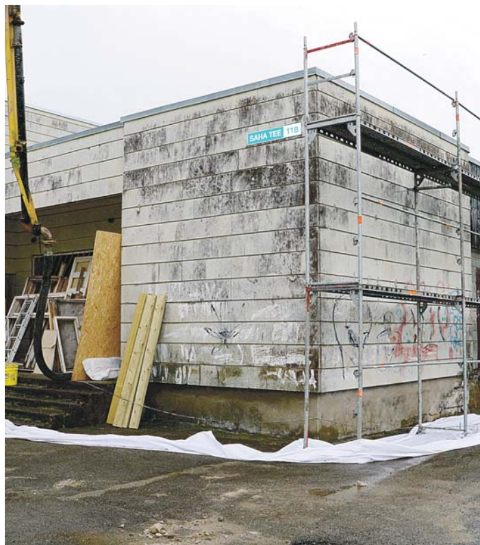
Tööd Loo noortekeskuses on täies hoos.