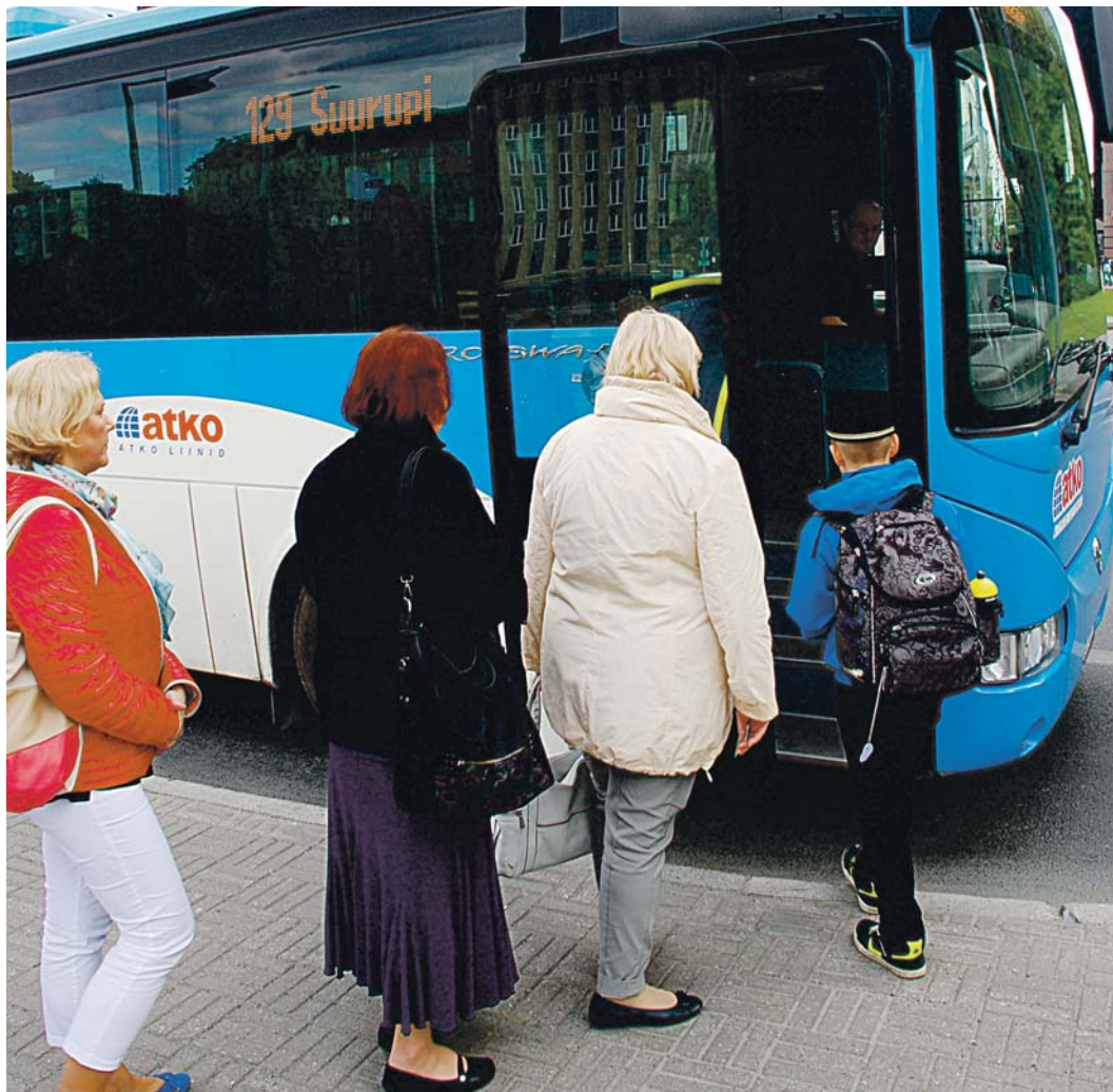
Sõit õppekohta ja tagasi hüvitatakse vastavalt kuludokumentidele, kuid mitte rohkem kui üks sõit edasi-tagasi õppepäeva kohta.

Noortekeskuse laiendamiseks saadi toetust EAS-lt Regionaalsete investeeringutoetuste andmise programmist 32 000 euro ulatuses. Peale ruumide valmimist sisustame noortekeskuse ka uue inventariga, mille finantseerimine toimub Jõelähtme vallavalitsuse eelarvest.