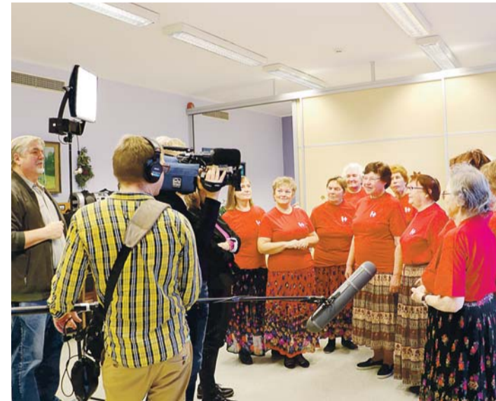
Pihlakobara oli külas ETV Prillitoos.