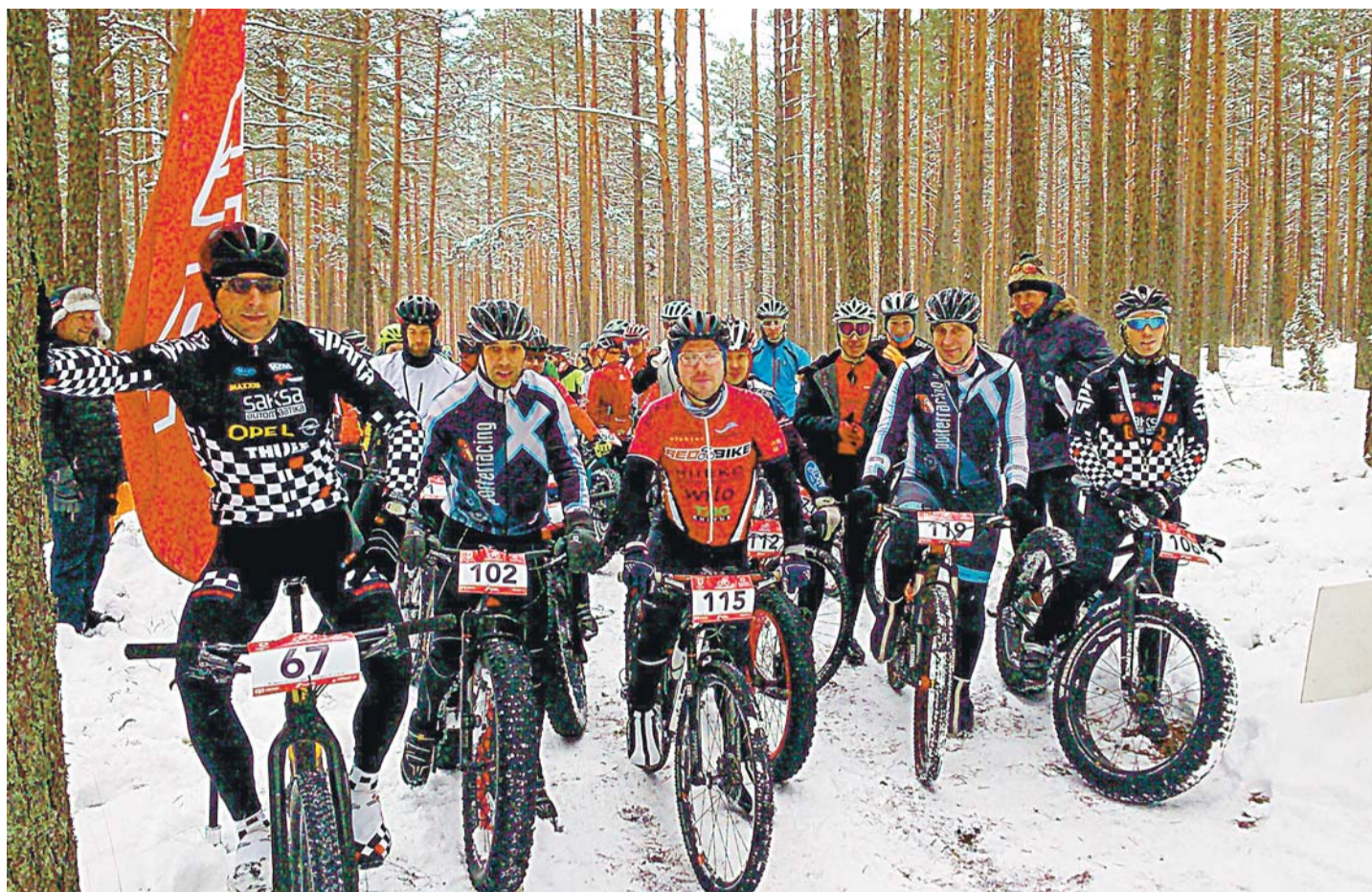
Kerge lumesadu, soojendav lõke, maitsvad pannkoogid ja kamp rõõmsaid rattureid ootamas Kodasoo-Ruu stardipauku.