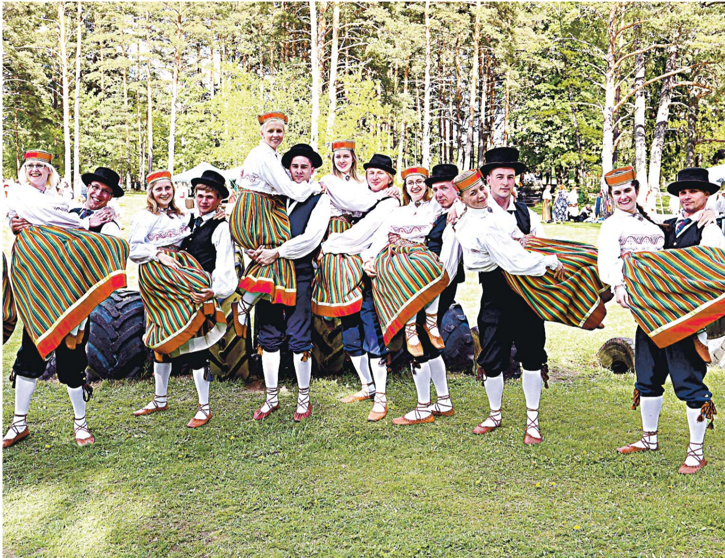
Esinemas ühispeol "Regilaul ja karuäke".