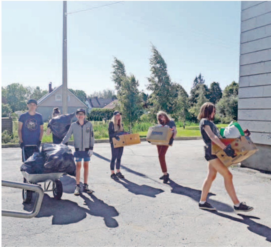
Loo malevarühm tööhoos.

Lisaks said noored vajalikke teadmisi infoturbest ja küberhügieenist, sotsiaalsest ettevõtlusest, nutifotograafiast, side- ja eritehnika kasutamisest maa- ja merepäästes ning Eesti Noorsootöötajate Kogu tutvustas läbi virtuaalreaalsuse prillide malevanoortele noorsootöö erinevaid ameteid. Toimusid ka Eesti Töötukassa CV koostamise koolitused ja töövestluse töötöad, Politsei- ja Piirivalveamet tutvustas noortele koeraomanike heaperemehelikkuse käitumise „Rihmaga on turvalisem” ning loomulikult ei puudunud malevast ekskursioonid kohalikesse ettevõtetesse ja toredad vabaajategevused.