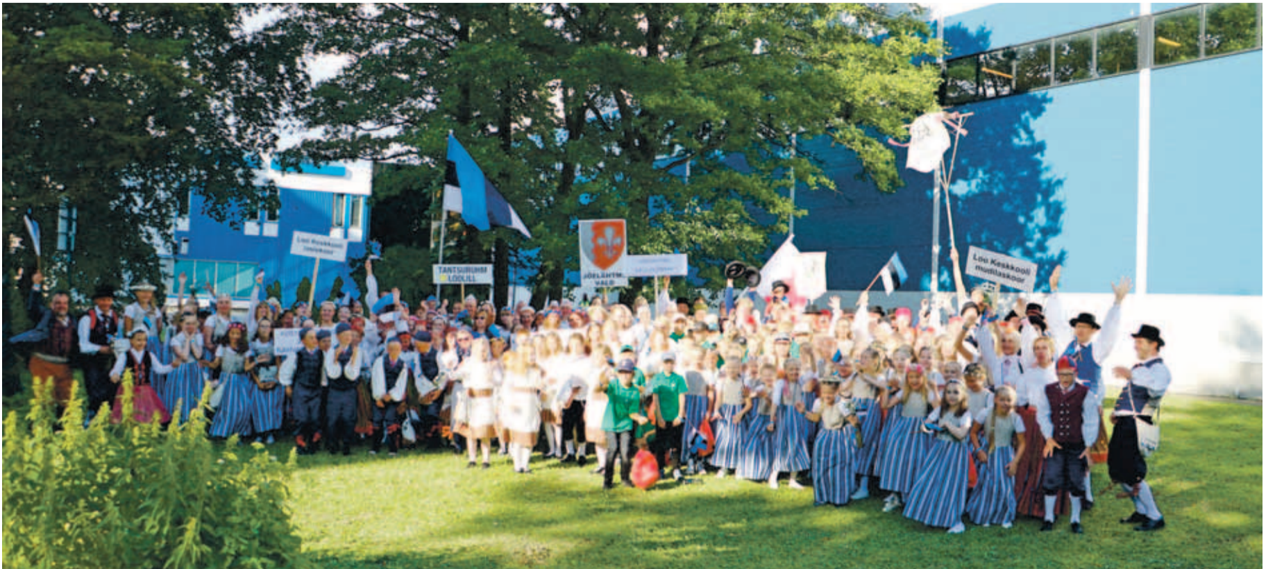
Jõelähtme kollektiivide ühispiit.

Mida pidu edasi, seda rohkem on soovijad tantsupeole. See tähendab aga väga suurt pingutust ja palju tööd. Treeninglaagrid, proovid ja jälle treeninglaagrid ja lisaproovid. Aga tulemus oli ju suurepärase – kõik rühmad peol. Suur rõõm oli tantsida Loo kooli saalis enne mõlemaid ettetantsimisi