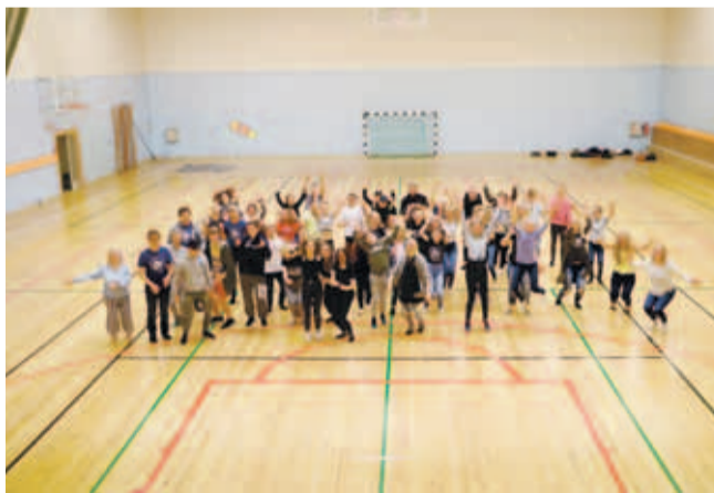
Maleva lõpetamine Loo spordihoones.