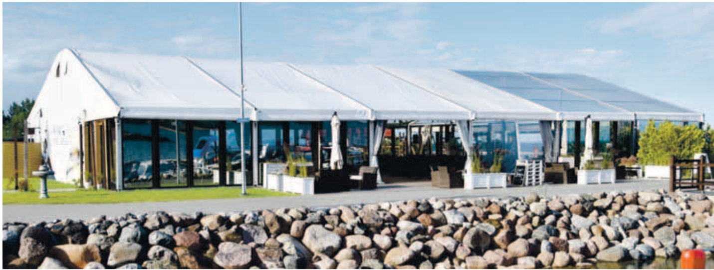
Klinkbergi peotelk Kaberneeme sadamas.