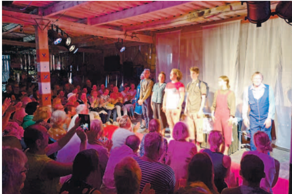
Hetk etenduselt Prangli sadamakuuris.

Uue hoone puhul on oluline ka olmetingimuste parandamine ja avardamine, samuti töökohtade arvu kasvatamine. Kui olemasoleva tehase võimekus on 30 töötajat, siis uue puhul see number kahekordistub. Lisaks kasutatakse tehase sisekujundusel Repstoni oma tooteid ja demonstreeritakse tehase võimalusi. Asukoha valikut