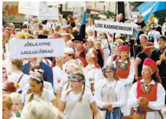
Elevust täis hetked enne rongkäigu algust

Juubelilaulupeol osalemine oli väga eriline kogemus. Laulupeo repertuaar oli väga rikalik ning kõlanud laulud puudutasid hinge. Oli võimas energia, mida lauljad laulukaare all koos lauldes suutsid tekitada. •