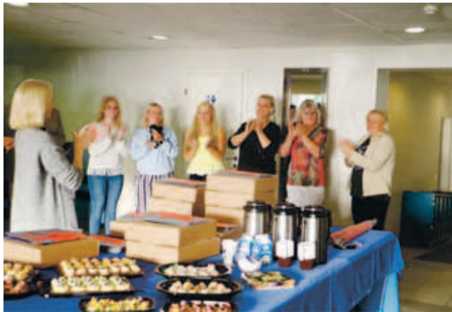
Suur aitäh tublidele malevajuhendajatele!