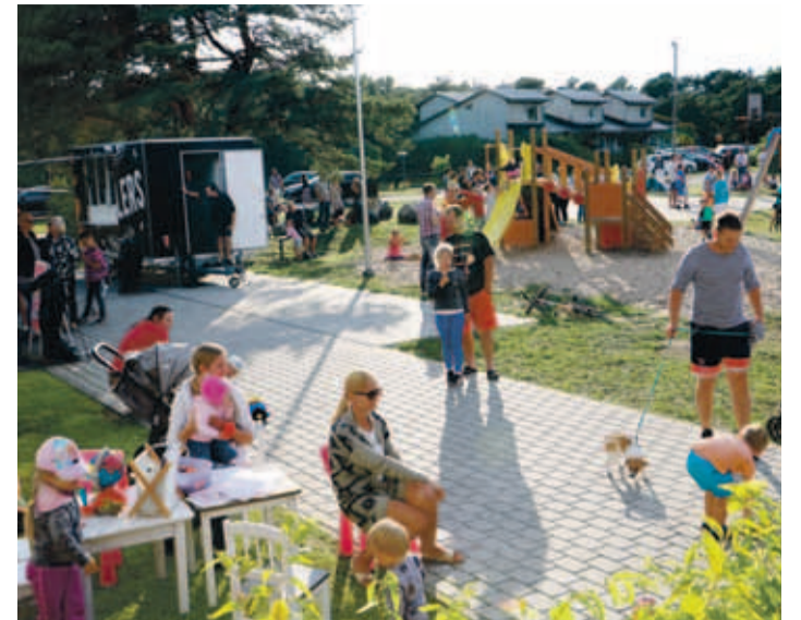
Neeme küla kaluritepäev toob tillukesse rannakülla alati palju rahvast kohale.