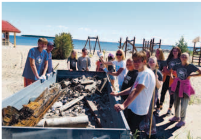
Neeme ja Kaberneeme rühma viimane tööpäev.

Jõelähtme Õpilasmaleva tegevusi toetab Jõelähtme Vallavalitsus ja noortemaleva toimumist rahastatakse haridus- ja teadusministri kinnitatud ning Eesti Noorsootöö Kesku poolt elluviidava ESF kaasrahastatud programmi „Tõrjutusriskis noorte kaasamine ja noorte tööhõivevalmiduse parandamine” kirjeldatud tegevuste raames. •