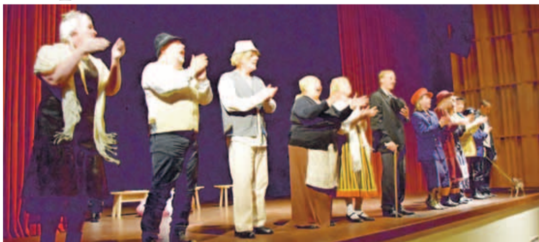
Jõelähtme LavaGrupp ja Wäike Tantsuteater MERI Leedus Kretingas teatrifestivalil.

Baltimaade harras- tusteatri festival „Balti Ramp“ sai algu- se 50 aastat tagasi. Festival on erinevatel aegadel kandnud küll erinevaid nimesid, kuid sisu on säilinud alates 1969. aastast, kui esimest korda said kokku Läti, Eesti ja Leedu aktiivsemad amatöörteatrid.