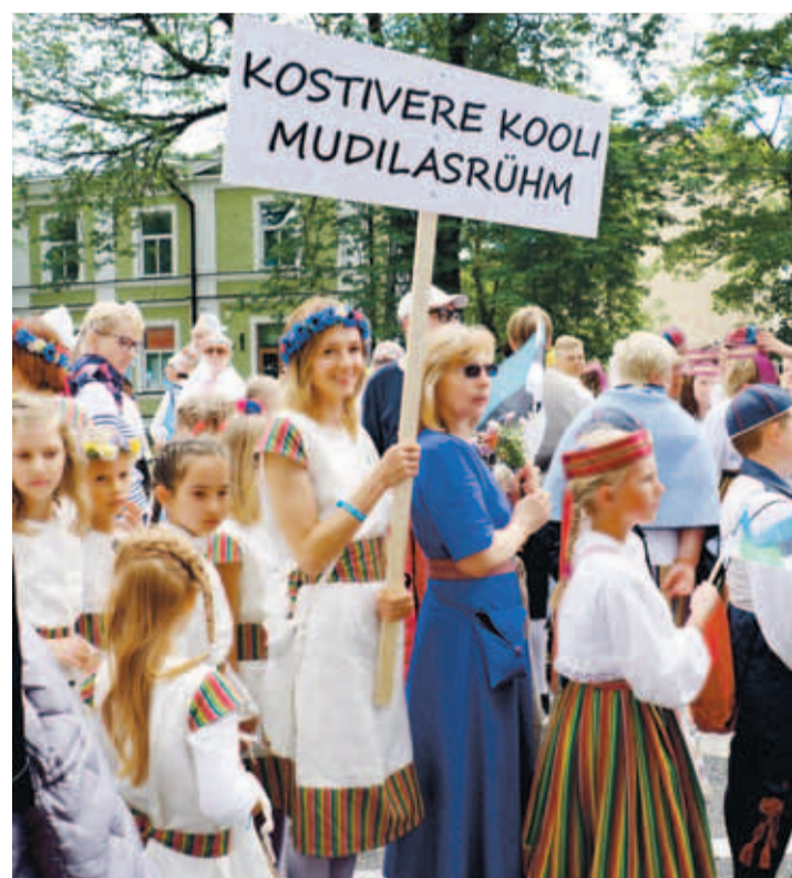
Kostivere kooli mudilasrühm.

Tahan kiita meie valla pisemaid, kes osalesid rongkäigus – hoolimata palavast ilmast ja ligi viie kilomeetri pikkusest distantsist jagus neil energiat ja särtu pealtvaatajatele lehvitada ja kõval häälele laule laulda, ei ühtki vingus nina ega virisevat nooti. Tõeliselt tore oli rongkäigu kohata ka oma valla inimesi, kes olid erinevatesse punktidesse Jõelähtme kollektiive tervitama tulnud. Pealtvaatajate seast tulevad hüüatused nagu „Elagu Jõelähtme!“, panid alati