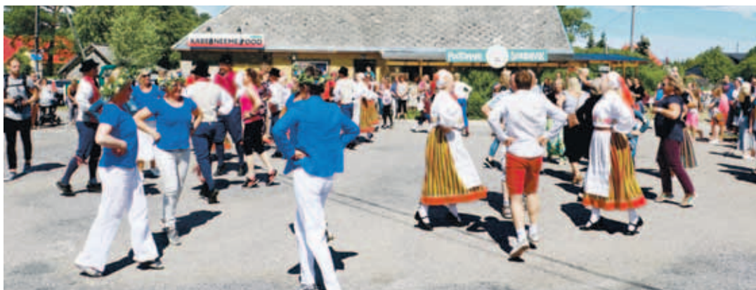
Millal siis veel Eesti rahvatantsu kaerajaini tantsida, kui mitte juubelitepo tule tervitamisel.