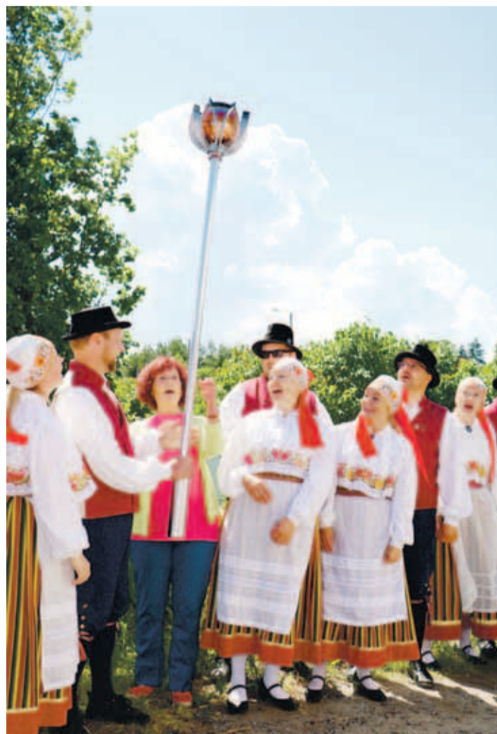
Tuletõrvik liikus käest kätte, et kõik kohaletulnud saaksid laulupeo tõrvikut korraks ka oma käega hoida.