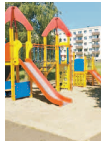
Loo pargi kinnistule (Saha tee 2, Loopargi tee 3 ja 4 vahelisele alale) kerkis juuli keskpaigas tore mänguväljak. Selle paigaldas Jõelähtme vallavalitsuse tellimisel OÜ Tiptiptap. Soovime lastele head mängulusti ja mänguväljakule pikka iga!