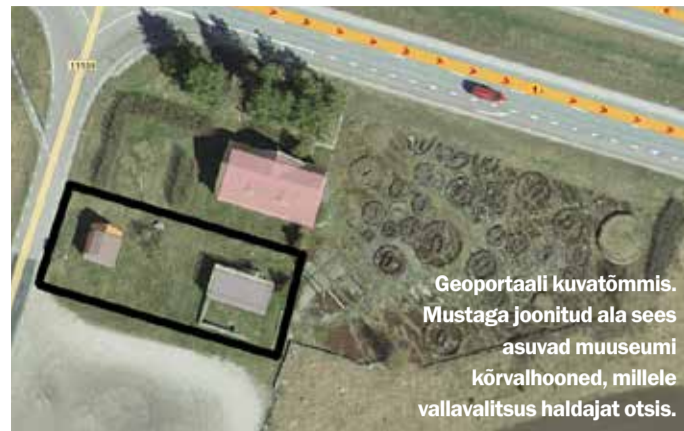
Geoportaali kuvatõmmis. Mustaga joonitud ala sees asuvad muuseumi kõrvalhooned, millele vallavalitsus haldajat otsis.

Ideekonkursi käigus käis objektiga tutvumas kolm huvilist, kellest esitas ideekonkursile taotluse ainult üks, MTÜ Jõelähtme Säästva Arengu Selts. Esitatud ideekavandit hindas Jõelähtme Vallavalitsuse ideekonkursi hindamiseks loodud žürii ja tunnistas MTÜ Jõelähtme Säästva Arengu Selts visiooni konkursi tingimustele vastavaks ja hoonete