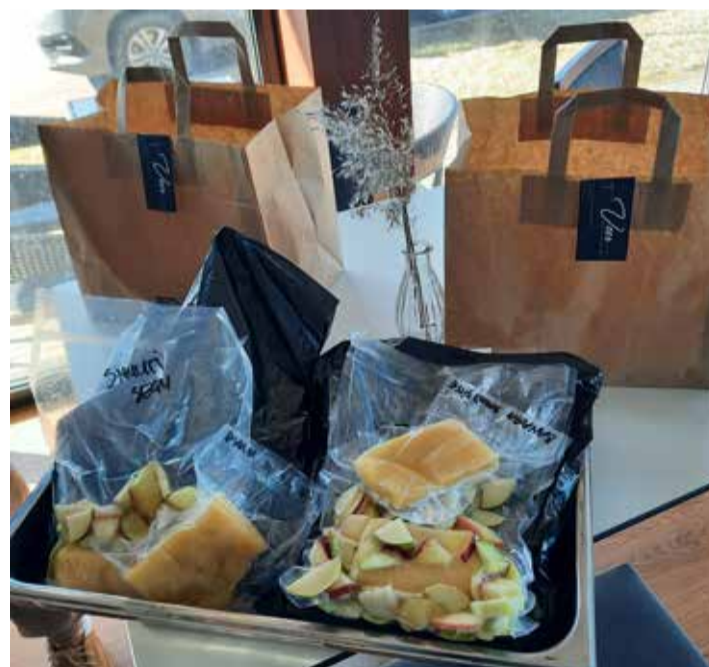
Valmistoidud on pakitud portsjonite kaupa vaakumkottidesse.

Esimesena haaras restorani Veer Köök ja Baar ideest kinni Karlskroona OÜ-ga, kes on iga nädal annetanud puu- ja köögivilju, millest Veeri kokad on meisterdanud supipõhjasid