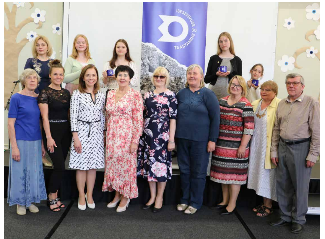
Tekste peale lugenud Kostivere kooli noored ning mälestusi jaganud Jõelähtme valla inimesed ühispidulil koos minister Kersnaga.