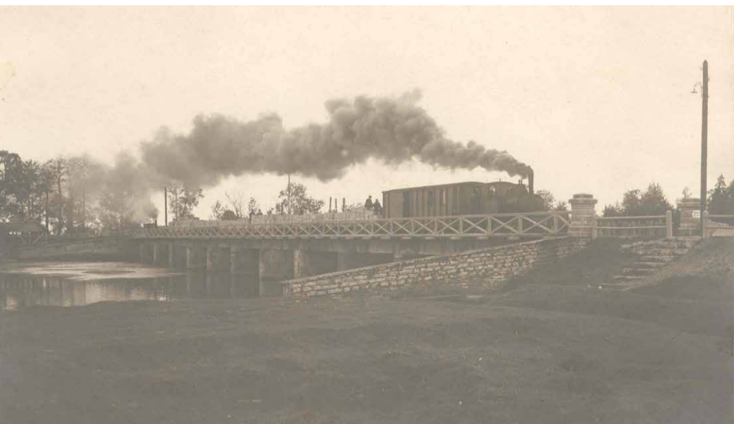
Jägala-Joa papivabrikust veeti suslaga papimassi Raasikule. Teekond kulges üle Suka silla. Raudteetamm on praegugi alles kuni Haljavani (kohalike seas on Sussi raudtee nimetus käibel veel praegugi). Foto umbes 1920ndatest.

Jägala-Joa majade ehitust alustati 1916–1917. Seal elasid puupapivabriku töölised. Suured barakid, enamuses üks tu-