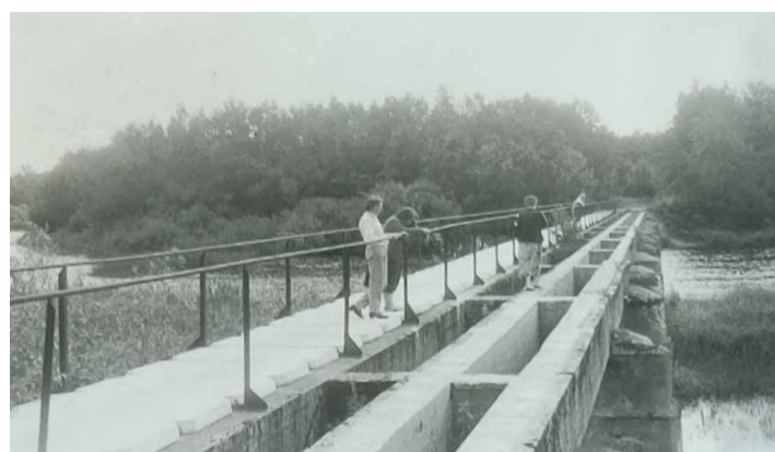
Suka sild 1993. aastal.

Seltsimajas oli ka raamatukogu, mille raamatud suudeti põlengu tagajärjel päästa ja viidi 6. kl algkooli ruumidesse. Juttude järgi olevat olnud üks koolimaja veel, umbes 1928. a