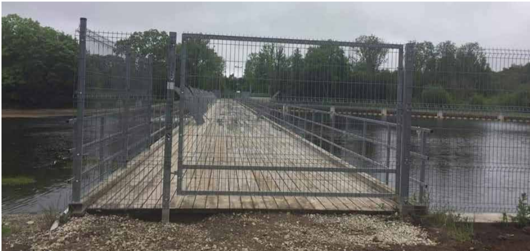
Sillalepääs on suletud kõrge metalliiridega. Vaade Koogi küla poolt kulgeva kergliiklustee otsast, eemaldatud on ka kergtee kattematerjal.

Alternatiivne lähim ülekäik Jägala jõest, milleks on riigimaanteel (Jõelähtme-Kemba) asuv Koeralooga sild, jääb Jägala jõest ülesvoolu umbes kilomeeter, kuid jalgsi jõe ületuseks tuleb läbida ligikaudu 5 kilomeetrit mööda riigimaan-