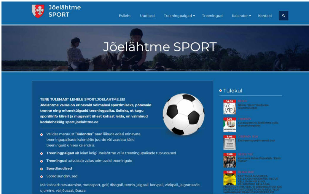
Kuvatõmmis sport.joelahtme.ee avalehelt.

Lehte täiendatakse jooksvalt ning selleks, et info oleks kogu aeg asjakohane, palume teie kõigi abi – kui Sul on spordiinfot, mida peaksid/võiksid teada ka teised, jaga seda palun ka meiega! Ootame infot e-mailile sport@joelahtme.ee.