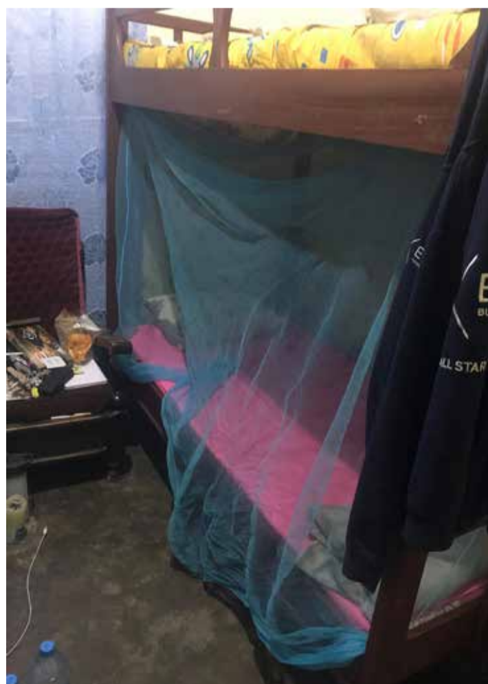
õpetaja kodule Tansaania viibimise ajal

ternetist Workaway lehe kaudu. Tegemist on keskkonnaga, kus sa saad valida üle maailma erinevate riikide vahel, ükskõik millise valdkonna või töökohta vahel ning kandideerida vabatahtlikuks. Workaway eelis ongi see, et saad minna oma valitud ettevõttesse ja oma valitud ajaperioodiks. Tööpakkumisi on alates teenindusvaldkonnast ja farmitöödest kuni kontoritööni. Üldjuhul on elukoht ja peavari tasuta, lennupileti peab ise soetama. Sellist elustiili, et reisid soodsalt mööda maailma, saad osa kohalikust kultuurist ja kogud kogemusi, harrastavad praegu väga paljud – ja mitte