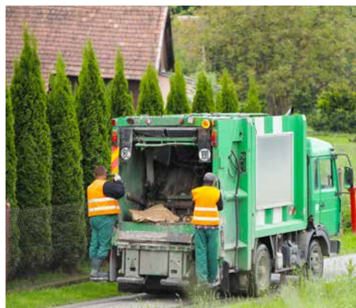
Mittenõuetekohaste jäätmete tasu on välditav, kui koguda jäätmeid liigiti.

Igal jäätmevaldajal võib tekkida perioode, kus jäätmeid ei teki või tekib neid tavapärasest