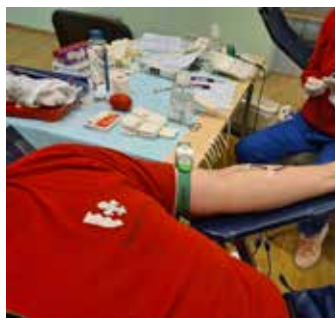
Donoripäev Loo kultuurikeskuses 29. detsemberil 2022.