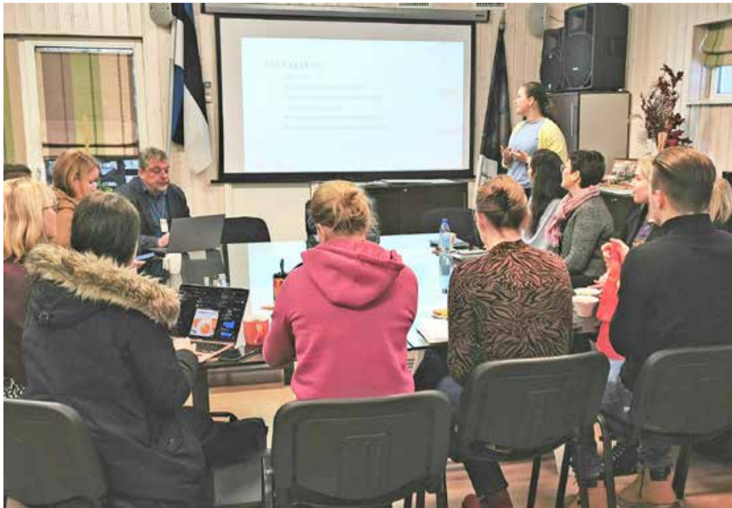
8. veebruaril toimus noorsootöö ümarlaud.

Jõelähtme vallas on noortele mitmeid osalusvõimalusi, näiteks noortevolikogu, õpilasesindused, noorte aktiivid ning võimalus otse panustada kogukonna edusse Arutledes, miks on vaja noori üldse kaasata, jõuti üheskoos arusaamale, et kui noor panustab omavalitsuse arengusse