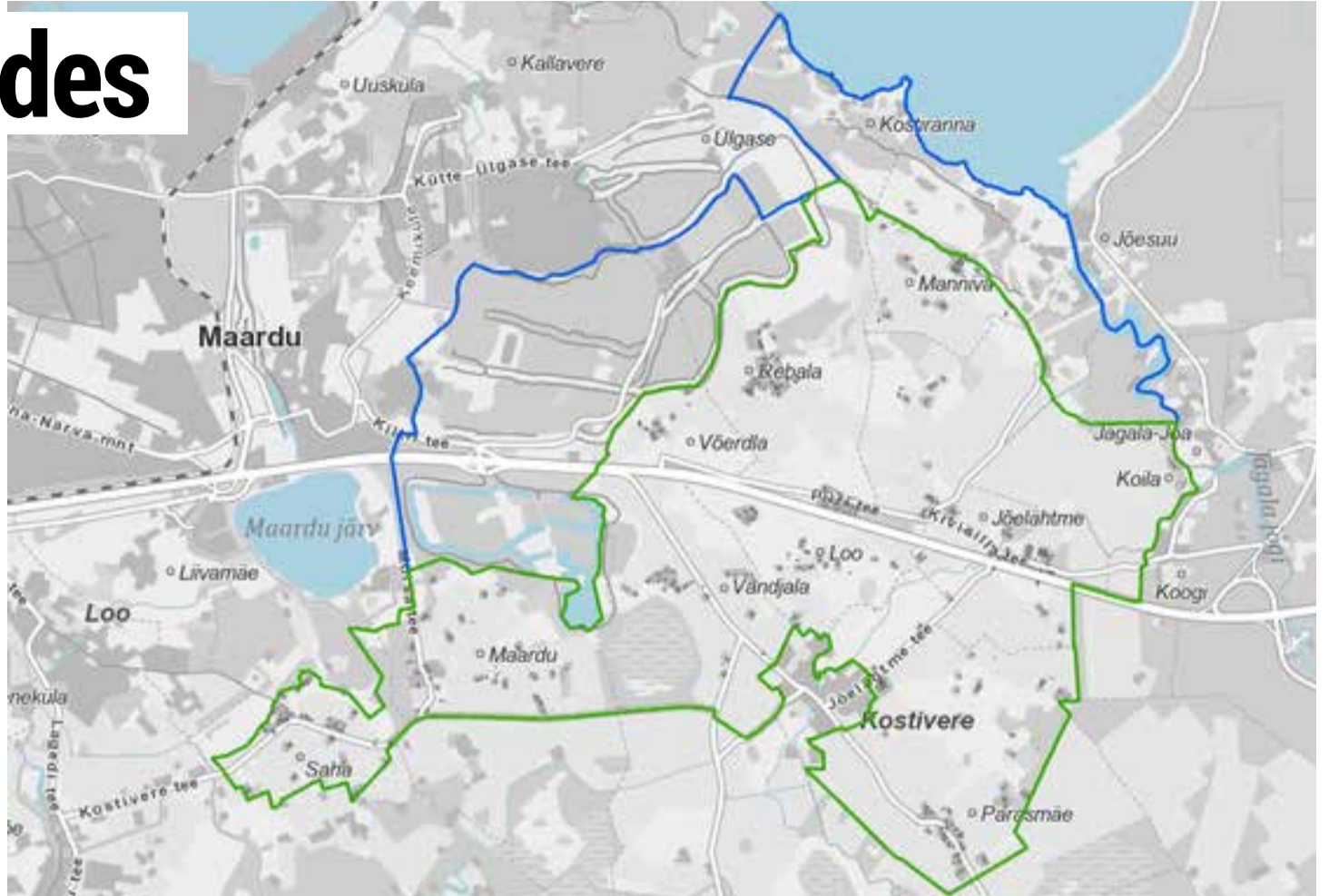
Rohelisega on tähistatud Rebala muinsuskaitseala ja sinisega muinsuskaitsevöönd

“ Muinsuskaitsealal elumaja või muid hooned omavate inimeste jaoks kaasneb uue kaitsekorraga oluline muudatus: kõikidele kaitseala hoonetele, mis ei ole kultuurimälestised, määratakse kaitsekategooriad.