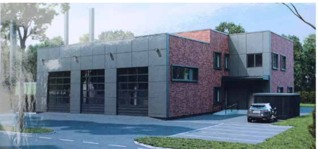
Kostivere noortekas ja päästehoone kuni 2023 veebruarini ja alates 2024. aastast.