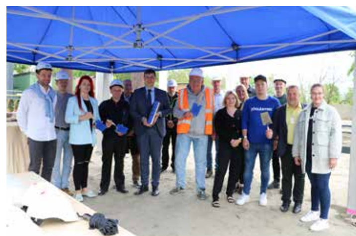
Nurgakivi asetamine 25. mail.