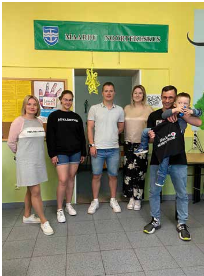
Noorsootöötajate meeskonnapäev Maardu noortekeskuses.

Kose vallas on keskused neljas erinevas piirkonnas: Kose, Habaja, Ardu ja Oru – külastati neist esimest. Kose