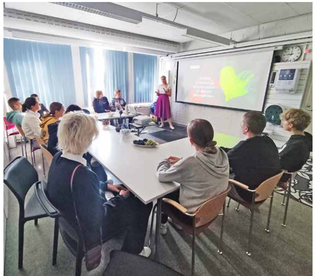
Loo kooli kogukonnapäev Lindströmis.