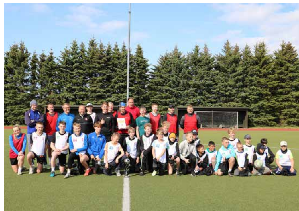
Jalkamatši meeskondade ühispiilt: vallavalitsus ja noored.

Tervelt 23 noort asus võistlema meie vallavalitsuse vastu, mis võimaldas olla noortel mängus värskemad ja teravamad. Omakeskis hoiti enda tiimil silma peal ning