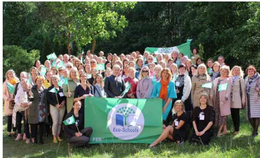
Rohelise lipuga tunnustatakse tublisid keskkonnanahoidlikke koole ja lasteaedu.

Kõik toidukorrad süüakse õues ning suur osa päevast veedetakse samuti õues. Lapsed armastavad sellist töökordlust, ehkki õpetaja abidele tekitab see veidi lisatööd. Sellel aastal andis õuelasteaiale tõe ka lasteaia soojustamine, mille tõttu rühmade tavapärase töö on paar nädalat teises rütmis. See vaheldust