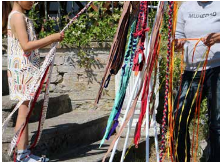
Tule Rebala keskus-muuseumi noorte laulu- ja tantsupeo üleskutse raames rahvuslikke paelu punuma kuni 2. juulini või osale juhendatud käsitöötubades!

Kohapeal saab lisaks väljapanekutega tutvumisele ka