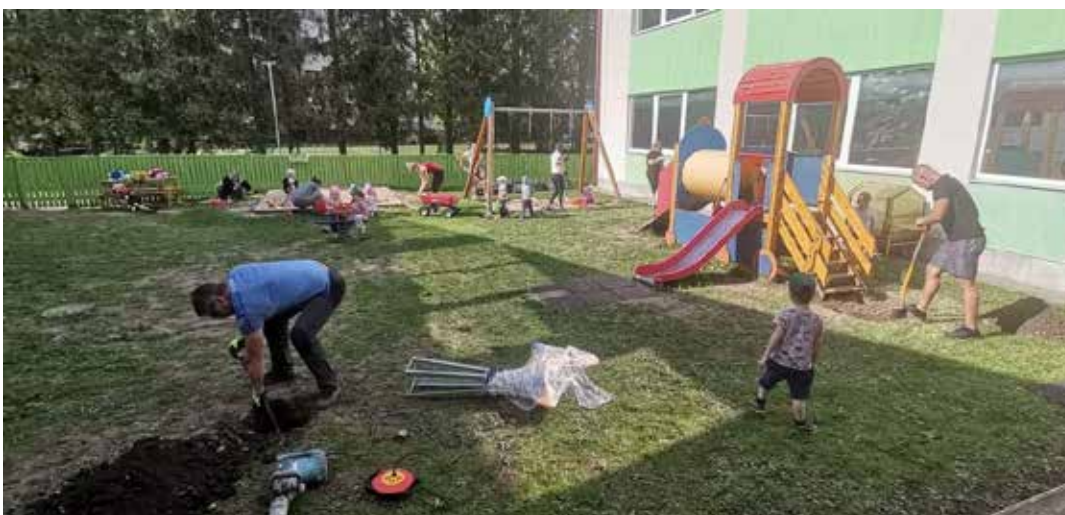
Pääsupesa talgupäev.

Tööd jätkus kõigile – õuealal pandi kiikede alla turvalised kummimatid, paigal-