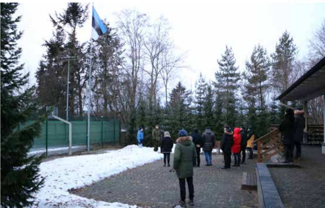
▲ Lipu heiskamine Iru külaplatsil.