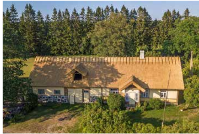
Toetuse abil korda saanud katus Läänemaal.

Toetust saab taotleda talukompleksi kuulunud eluhoonele ehk üksikelamule, mis on ehitatud enne 1940. aastat ning voo- rüst toetatakse hoonete katuste restaureerimist traditsiooniliste ehitusmaterjalide ja töövõtetega. Sel aastal avaneb taluarhitektuuri taotlusvoor kuundat korda.