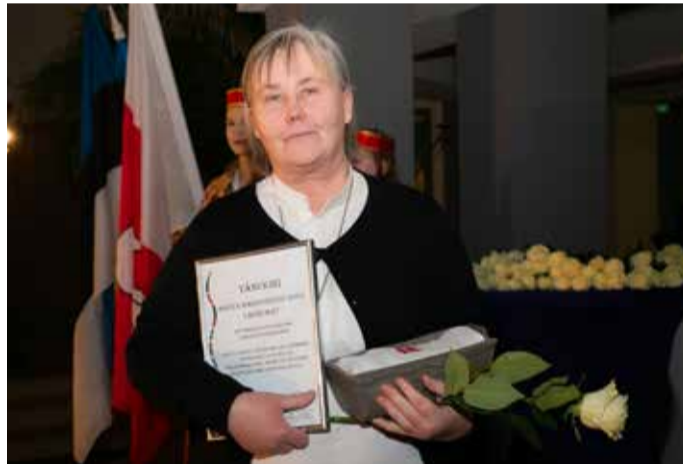
Aasta haridustegu – MTÜ Rebala Kultuuriruumi loodusõppeprogrammid.