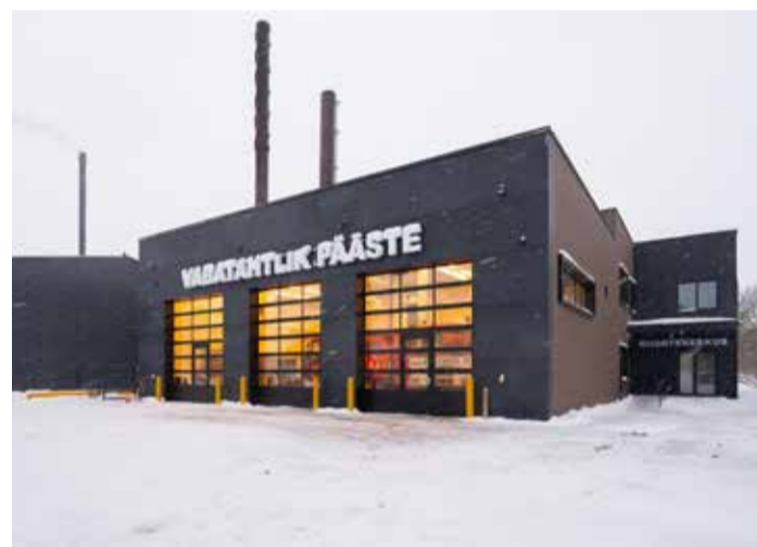
Uus ühine hoone.