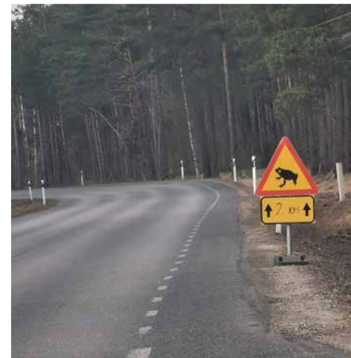
2023. aasta konnarände ohuteavitused Ihasalu poolsaarel.

Kui Sul on jõudu olla abiks kevadisel konnarändel, olgu see siis tõkete seadmine või konnade kandmine, palun võta ühendust kluhaaar@gmail.com või telefonil 5647 1170.