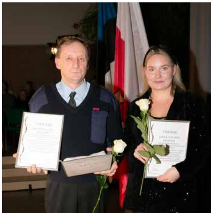
Aasta tegu – Kostivere noortekeskuse ja päästedeppoo uue ühise hoone ehitamine. Kostivere Tuletõrje Seltsi liikmed ja Kostivere noortekeskuse noorsootöötajad panustasid südamega uue hoone valmimise ja ümberkolimistöösse.