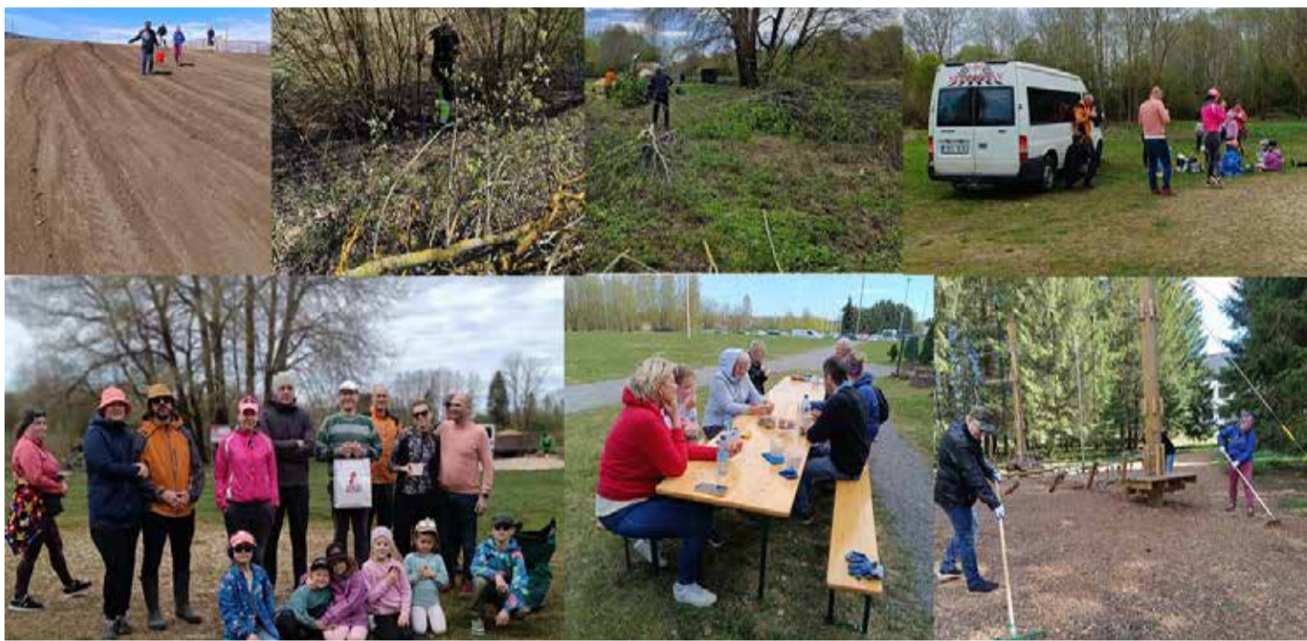
Loo aleviku talgulised.

Täname teid kõiki meeldiva 5. mai päikeselise laupäeva hommikupoole virgutuse eest! Meil oli tore koostegemine ja TEGIMEGI ÄRA! Talgulisi oli rohkem kui mullu, kokku 17. Talgute korralduse keskbüroole sai üles antud 20 osavõt-