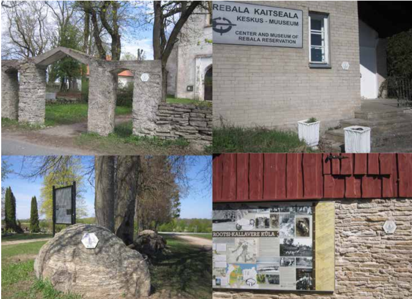
Palverännutee märgid Jõelähtme valla pühakodade ja muuseumite juures.