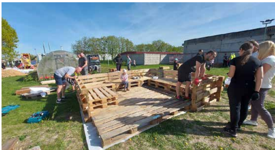
Loo Pääsupesa lasteaia koristustalgud.