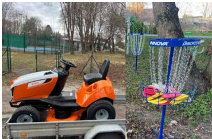
Iru küla 2023/24 projektid, mis on rahastatud kohaliku omaalgatuse programmist.

Iru küla nimel olen kirjutanud mitmeid taotlusi KOPi rahastuse saamiseks ja nii on