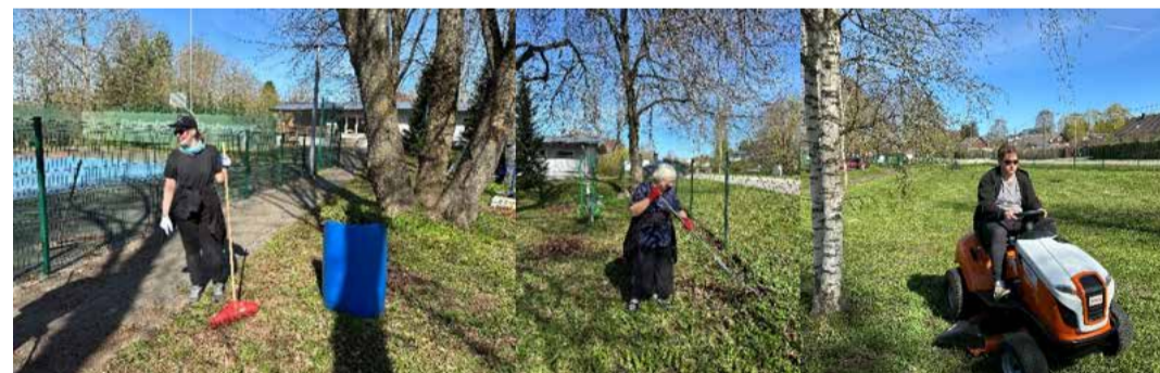
Iru küla kevadtalgud.