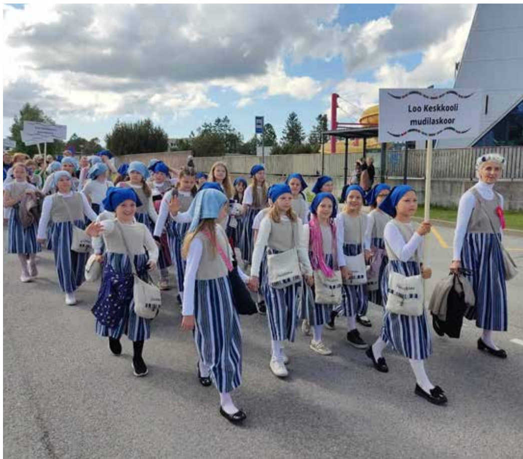
Loo kooli esindasid Harjumaa laulu- ja tantsupeol kolm koori.

Rõõm oli näha, et väga paljude noorte vanemad olid tulnud rongkäigule ja peole kaasa elama, ju see laulu- ja tantsupidu ikka midagi erilist on! Ühise Jõelähtme valla lipu taga jalutamine löi suure ja mõnusa kokkukuuluvustunde, olime kui üks mesilaspere, kes säras uhkusest tehtud töö üle.