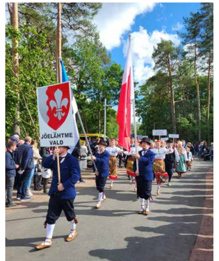
Jõelähtme kollektiiv rongkäigul.

päikesekreemi, kanda tuulejopet, olla valmis vihmaks. Etenduse päeval toimunud läbimängul sai trotsida nii nõrgemaid kui tugevamaid vihmahoogusid, kuid miski ei vähendanud tantsijate tahet ning rõõmu koostantsimisest. Usk ja lootus jäi, et kontserdiks on kõik kõige paremas korras. Nii see ka läks! Ühiselt tantsiti