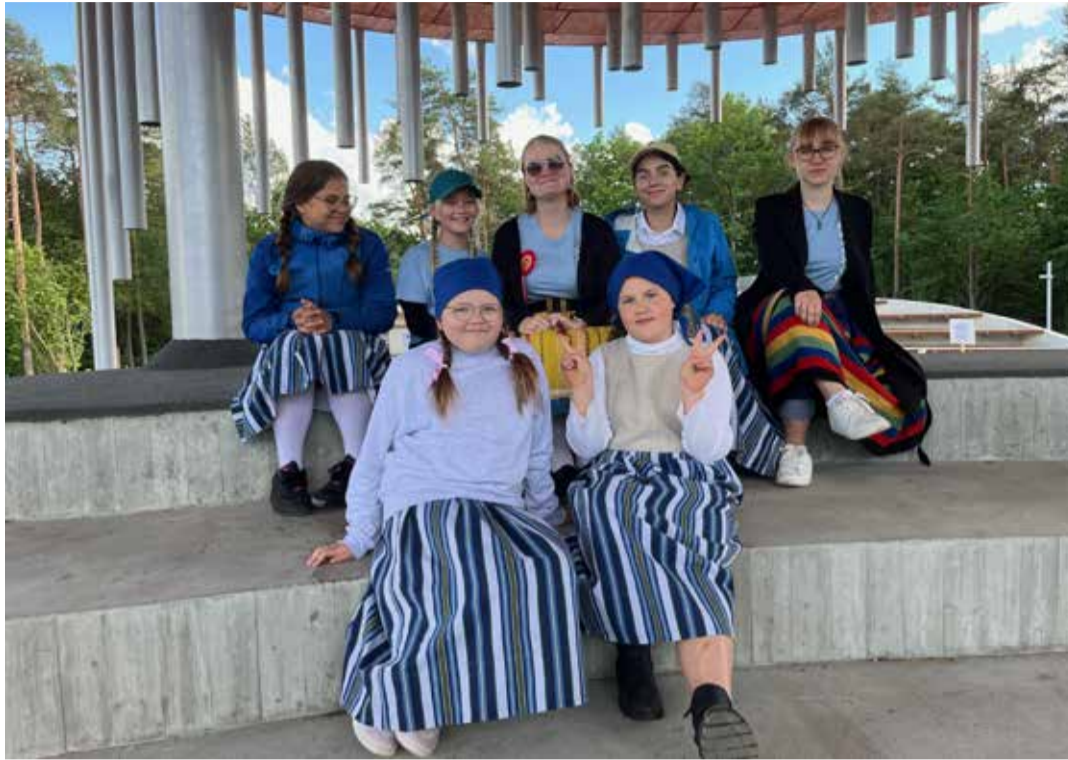
Jõelähtme muusika- ja kunstikool Keilas Harjumaa pidupäeval.