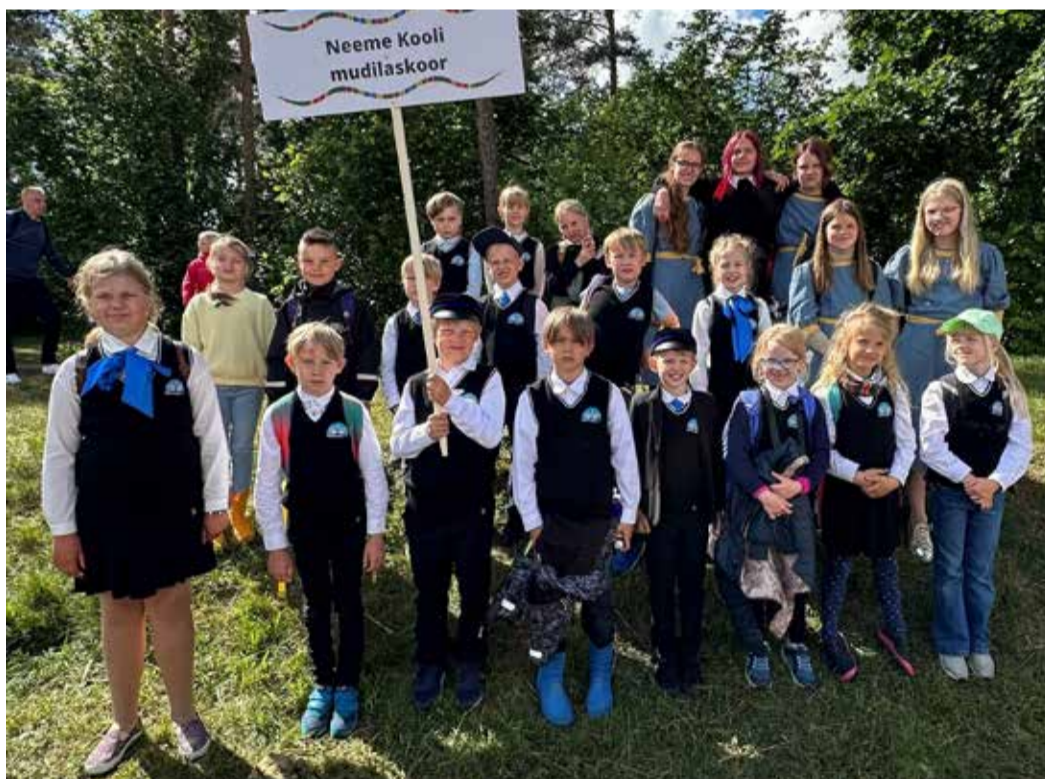
Neeme kooli lauluvägi enne rongkäiku.

Jõudsime värskelt avatud uhkele Keila linna lauluväljakule. Kuigi laululaval oli kitsas ja dirigendi käsi jäi teiste lauljate taga olles nähtamatuks, lauldi siiski täiel rinnal kaasa. Proov edukalt tehtud,