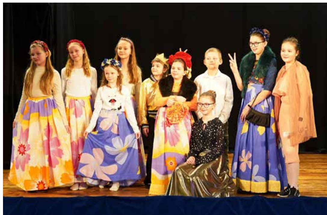
Kostivere laste teatri noorema ja vanema grupi ühispilet.