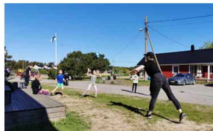
Neeme kooli MoNo.

Neeme MoNo osales umbes 30 noort ning kindlasti on plaanis sellega jätkata ka sügisel. •