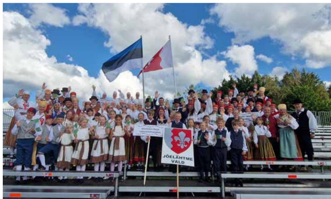
Rahvatantsijate ühispilt, pildilt puuduvad Jõelähtme Pisikesed ja Jõelähtme Seniorid.

Sellise suure peo toimimine on suur väärtus meie rahvakultuurile , ühendades