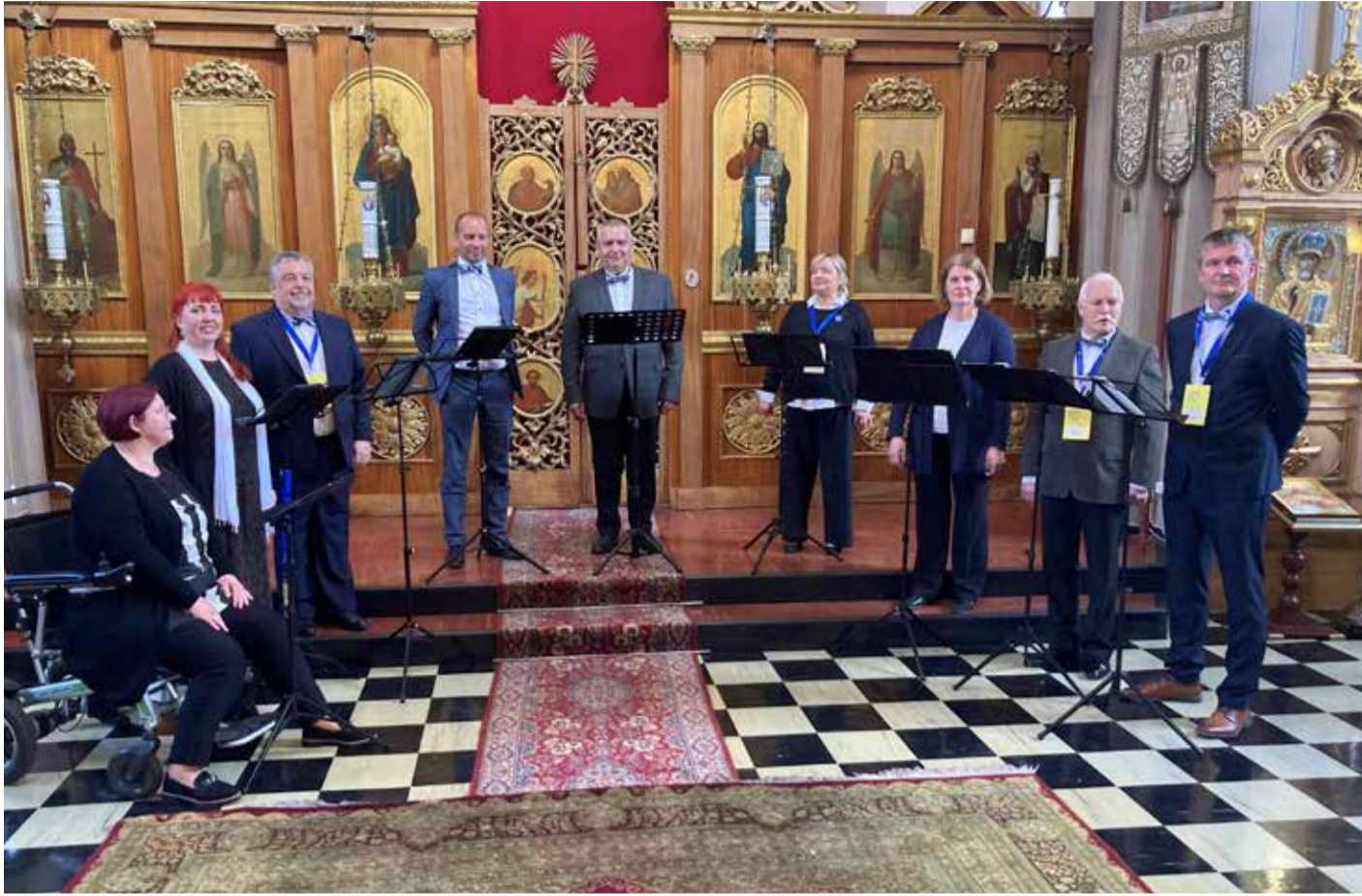
Vokaalansambel AnnabRe Soomes XXX Vaasa koorifestivalil.