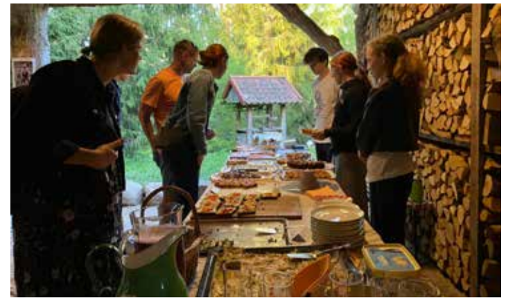
Külakohviku maitseed Rootsi-Kallavere küla muuseumis.

Kui üks kollektiiv on koos laulnud ja loonud juba 23 aastat, jagub sellesse aega üksjagu koosreisimist. Reisil teadupärast selgub alati, kas „üks kõigi ja kõik ühe eest“ põhimõte töötab. Meie ansambli puhul pole selles kolnagi olnud vaja kahelda, polnud seegi kord erand. •