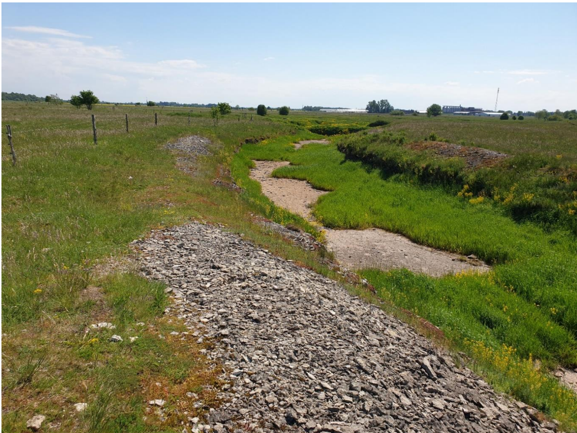
Foto Kostivere maastikukaitseala pärändniidust ja kuivanud jõesängist on teinud Evelin Loel

Rebala muinsuskaitseala üheks eesmärgiks on tagada looduse ja inimese kooseksisteerimise tulemusena ajalooliselt välja kujunenud asustusstruktuuriga põllumajandusmaastiku terviklik säilimine. Senistel andmetel leidub siinses piirkonnas lisaks arvukatele arheoloogilistele objektidele (kalmed, kultuskivid jmt), ehituspärändile ning ajaloolistele põllumaadele ka ulatuslikult pärändkooslusi.